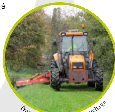
Tracteur équipé pour le fauchage

Il permet aussi de jouer pleinement la carte de la solidarité avec les petites communes qui ne possèdent ni personnel communal ni matériel. Ces agents effectuent en ce sens une véritable mission de service public à destination des usagers.