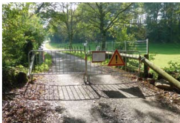
La route entre Aillevans et la D80 est interdite à la circulation pendant la durée des travaux

Les travaux sont réalisés par l'entreprise CARSANA de Jussey. Ils consistent en la déconstruction de l'ouvrage existant et la reconstruction d'un ouvrage acceptant tout tonnage.