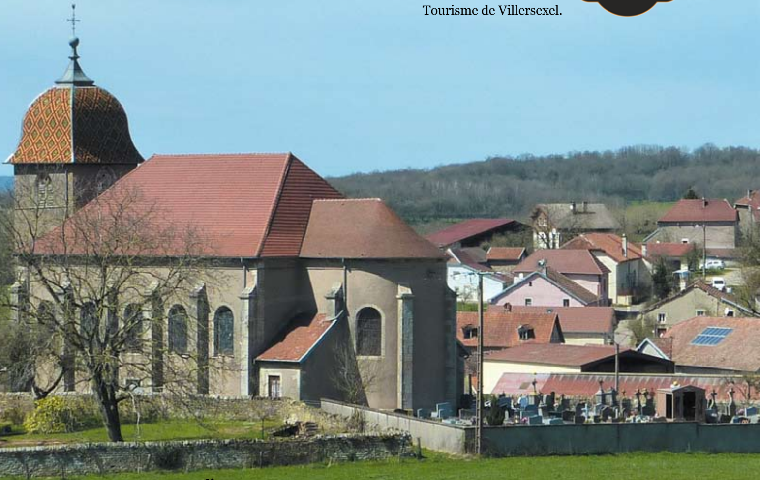
Vue sur Courchaton et son église