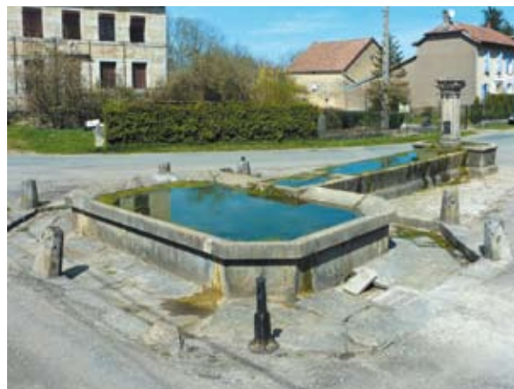
Une des 8 fontaines de Courchaton

de la mirabelle. Des vestiges de cette tradition sont toujours visibles dans le village, où vous pourrez admirer d'anciennes maisons vigneronnes. Même si le vin ne coule plus à flots, l'eau, elle, continue d'alimenter les huit fontaines du village. L'église coiffée d'un joli clocher comtois est ouverte tous les jours. A l'intérieur, deux retables sont visibles de part et d'autre du chœur. Ce village offre bien des possibilités pour les visiteurs. Les sportifs iront faire un tour au poney-club le Picotin, qui propose des cours d'équitation